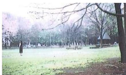
工業団地内にある大公園

近い将来、首都圏直下地震の発生も予測されると報道もありますが、我々は安全対策の一環としてあの日の教訓を生かされているのか検証することです。工業会で配布した防災本が社員、ご家族、ご近所の方々に教えて頂ければ私達の活動の輪が広がることになります。また、そう願っています。工業会周辺 2km グリーンベルト、工業団地内にある大公園等々含め再確認して下さい。 帰宅困難者（各社対応）にも何かお役に立てるか、研究検討も必要な課題、雇用のお役に立ちたいと思っています。