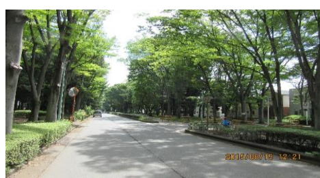
2 km 続くグリーンベルト(幅 50m)