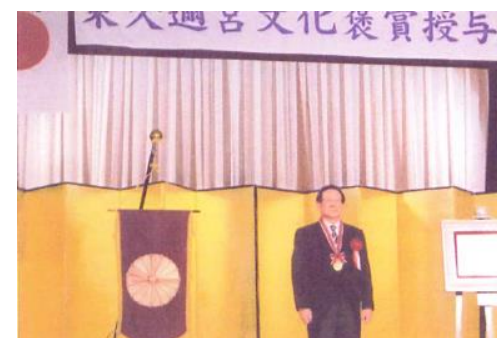
学士会館で授賞式の模様

この賞は、社会や公共・文化振興などに貢献した人物を顕彰する目的で設立された褒賞で大変権威あるものです。過去の受賞者には、中川秀直氏(政治家)、三浦雄一郎氏(登山家・元プロスキーヤー)、第 69 代横綱 白鵬など各界の著名人が受賞されています。