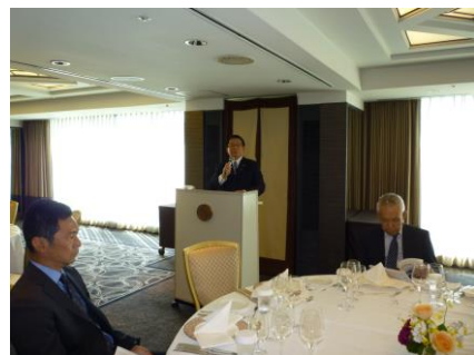
沼尾会長より工業会報告