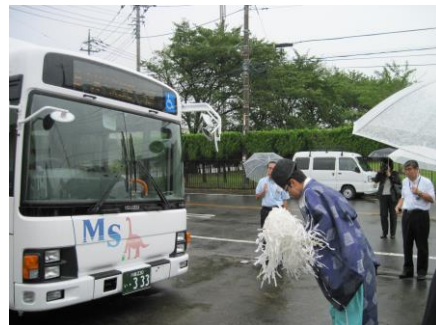
8 月 28 日(木) 3 号車出発式“安全祈願”

沼尾会長よりご挨拶があり、交通安全推進委員会報告として経過報告並びに事業計画及び工業団地内の交通事故マップの説明を致しました。バス委員会報告として事業報告と計画について、又、バス停マップ説明と 3 号車の入れ替えについて交通安全祈願の出発式報告を行いました。