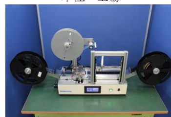
テーピング加工機