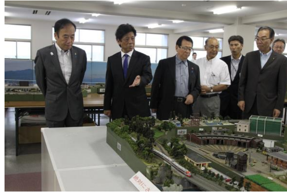
「埼玉新聞平成 28 年 7 月 23 日付」