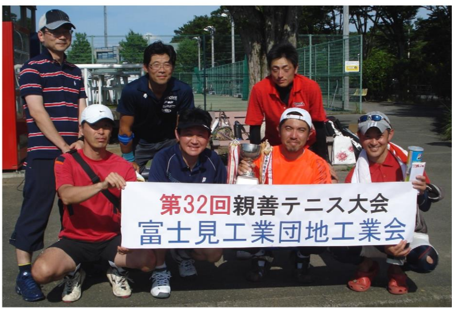
V3達成の(株)タムラ製作所チーム

福利厚生委員会事業の親善テニス大会は、7月10日(土)坂戸市民総合運動公園テニスコートに於いて、5社10チームで熱戦が繰り広げられました。栄えある優勝は、(株)タムラ製作所Cチーム、準優勝には、惜しくも東洋インキ(株)Bチーム、そして3位に東洋インキ(株)Aチームとなりました。皆さん暑い中お疲れ様でした。